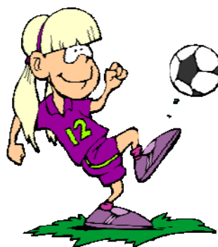
jouer au foot