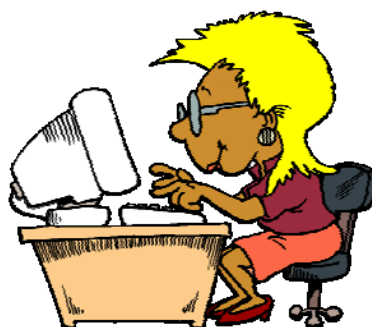
utiliser un ordinateur