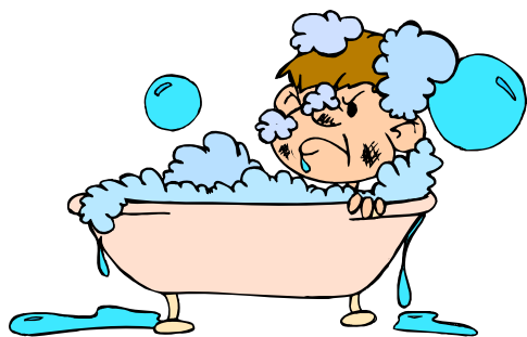
prendre un bain