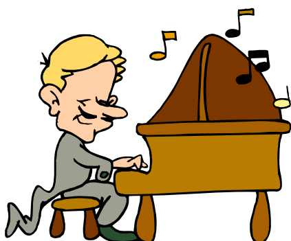
jouer le piano