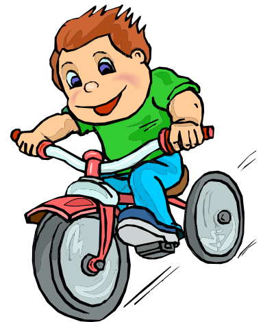
faire du vélo