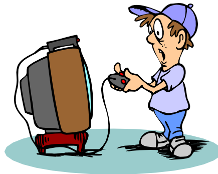
jouer des jeux video