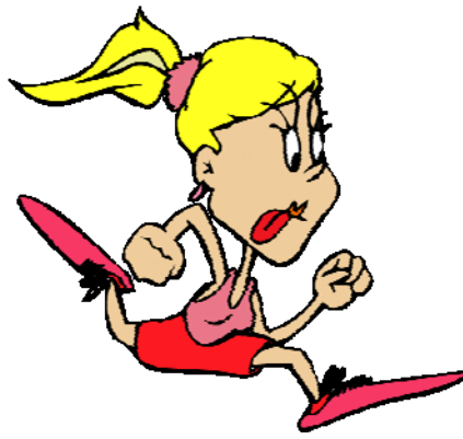
laufen / rennen